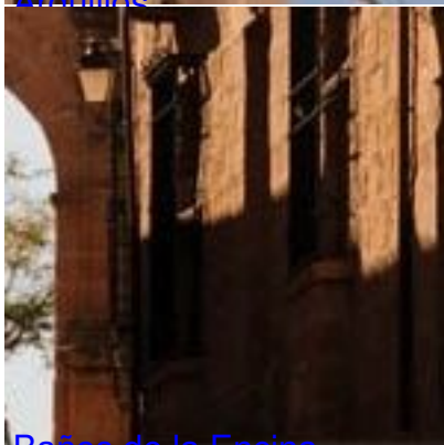
Baños de la Encina