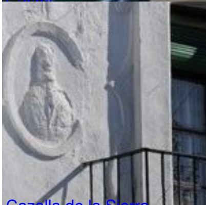
Cazalla de la Sierra