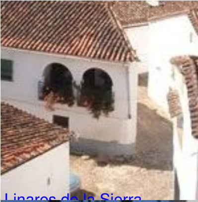
Linares de la Sierra