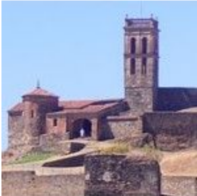
Almonaster la Real